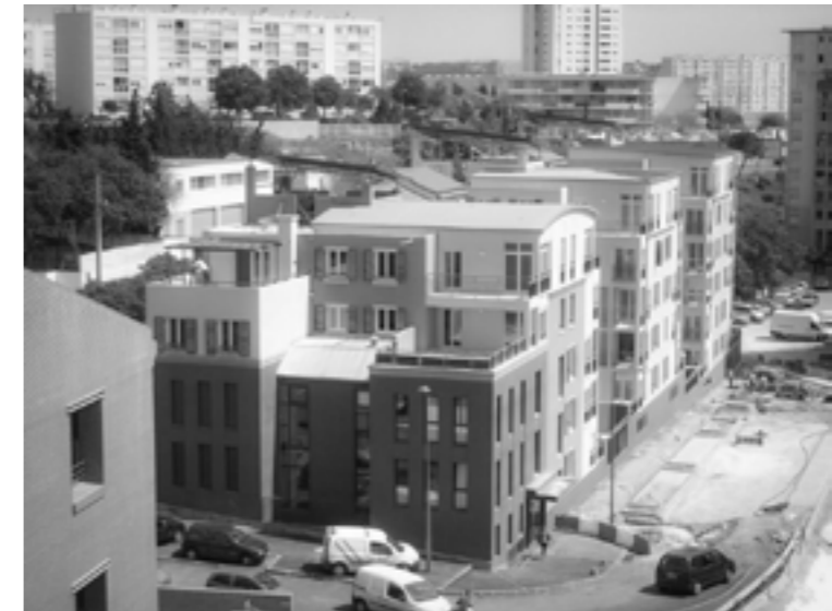
Les Flamants, étape de la rénovation