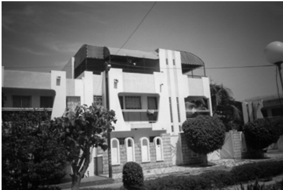
LFKs - Maison des enfants de Man-Keneen-Ki, Dakar, dessinée par François Bauchet - 2001

1996-2006, Man-Keneen-Ki, jeunes errants de Dakar