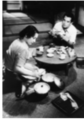
Le Shomin-geki, histoires des gens ordinaires, cinéma de genre